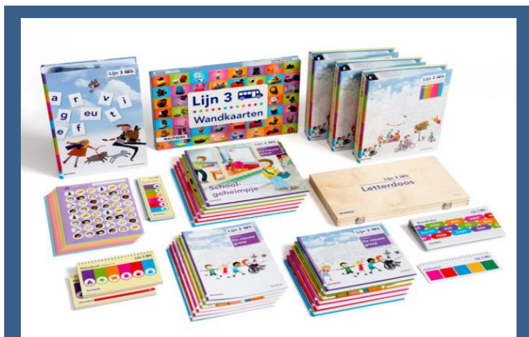
Leermaterialen leesmethode Lijn 3

Wanneer u zelf nog leuke activiteiten wilt doen, kunt u kijken op www.kinderboekenweek.nl . U krijgt ook het kinderboekenweekgeschenk bij aankoop van 10 euro aan boeken cadeau! Dit jaar krijg je 'zestig spiegels' van Harm de Jonge cadeau!