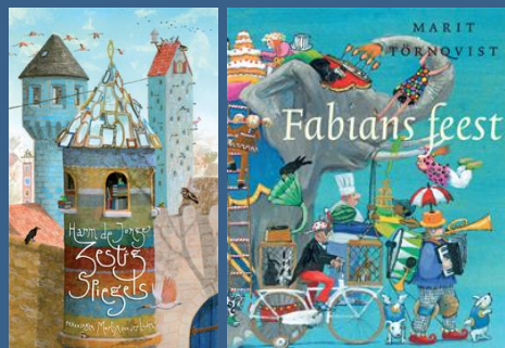
kinderboekenweekgeschenk en prentenboek 2014!